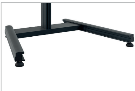
feinjustierbare Stellfüße für präzise Ausrichtung